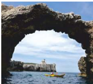
L'architiello di Caprara

Splendide le grotte marine, le più famose quella delle Viole, dalla limpida acqua smeraldina , la Grotta del Bue Marino e la Grotta delle Rondinelle; pittoresche insenature e gli scogli dalle forme fantasiose come quelli dell'Elefante, l'Architiello di Caprara e i Pagliai con la bellissima spiaggia Beautiful sea caves, the most famous of which are the Violets with clear emerald water, the Grotta del Bue Marino and the Grotta delle Rondinelle; coves and rocks with imaginative shapes like those of the Elephant, the Architiello of Caprara and the Pagliai.