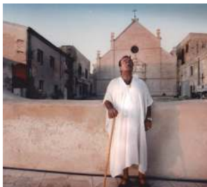
Lucio Dalla alle Isole Tremiti

Oltre che un uomo e una persona di cuore... "Uno dei più importanti, influenti cantautori italiani . Alla ricerca costante di nuovi stimoli e orizzonti, si è addentrato con curiosità in svariati generi musicali, collaborando e duettando con molti artisti di fama nazionale e internazionale . L'album (2001) Luna Matana è una licenza poetica che allude a Cala Matana, l' insenatura che scende a strapiombo sul mare, a San Domino , dov'erano situati casa e studio del compianto, immenso Artista (fonte: Wikipedia)