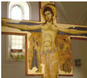
Alto 3,44 mt, largo 2,58

Presenta gli occhi aperti, trionfanti sulla morte, con lo sguardo dipinto in modo che da qualsiasi angolazione lo si guardi, sembra di essere osservati . La leggenda narra che una nave arrivò da oriente arenandosi sulle coste tremitesi. Saliti a bordo, i suoi abitanti trovarono solamente l'imponente crocifisso che li fissava. Decisero di portarlo in processione fino all'abbazia, ma per le sue dimensioni esso non entrava nelle porte della chiesa. Fu lasciato la notte fuori ma al mattino, quando tornarono, il crocifisso era all'interno.