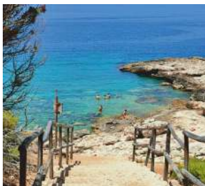
Una delle splendide calette

Le isole Tremiti nonostante il loro immenso splendore hanno prezzi abbordabili , alcuni esempi: per dormire si parte da poco più di 30€ a persona, per un caffè seduti vicino al mare solo 1€ , panini da 3€, pranzi da 20€, l'ingresso in discoteca è libero, cocktail da 6€, la bottiglietta d'acqua in un bar 1,5€, le bibite 3€, il giro delle isole in motoscafo 25€, taxi e traghetti da 3€. Prezzi normali per luoghi che sono di impagabile bellezza !