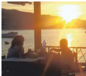
PRENOTA LA ZUPPA DI PESCE

Saremo lieti di darvi il benvenuto nel nostro mondo... Snorkeling, immersioni guidate e corsi dall'open water diver all'istruttore. Battesimo del mare, full-day immersion Immersione sotto le stelle per emozionarvi. Rilascio brevetto internazionale RAID. Snorkeling, guided dives and courses from the open water diver to the instructor. Baptism of the sea, full-day immersion Diving under the stars.