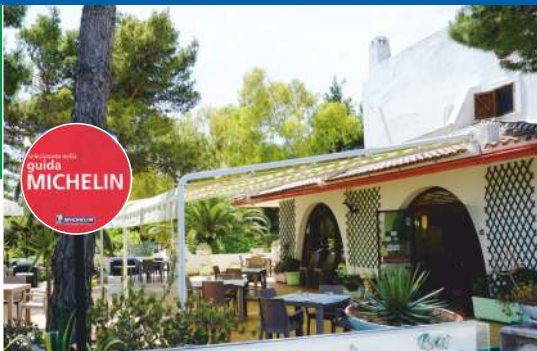
Tavola fredda a Km 0 nello splendido giardino per un completo relax; Hotel a conduzione familiare con camere complete di tutti i comfort; ottimo ristorante con cucina tipica locale. Cold table at Km 0 in the splendid garden for complete relaxation; Family-run hotel, rooms complete with all comforts; excellent restaurant with typical local cuisine.