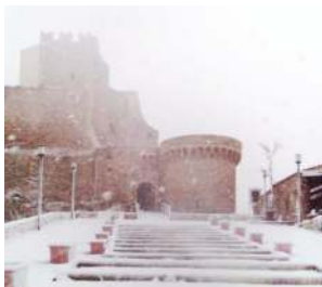
La neve al castello (2018)

Vivere alle Isole Tremiti, nei mesi dove il turismo è completamente assente (novembre/marzo), è un'esperienza di vita che rigenera l'anima. Il tempo si scandisce magicamente, tra l'arrivo della nave al mattino (unica corsa) e il tramontare del sole sul mare. La popolazione residente, nel periodo fuori stagione, è di circa 150 persone, suddivise tra San Domino (la più popolata) e San Nicola. Le giornate trascorrono serene e seppur non manchi nulla o quasi, ci si accorge che per vivere felici basta l'essenziale.