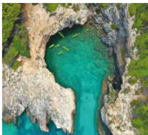
Cala tonda, San Domino

L'arcipelago è circondato da varie insenature, in particolare l'isola di S. Domino dove sono facilmente accessibili tramite i sentieri che partono dal centro del paese. Sono baie di roccia, dove comunque la discesa a mare è comoda e il fondale non è subito alto. The archipelago is surrounded by several bays, particularly the island of San Domino where they are easily accessible via paths from the center of town. convenient descent to sea