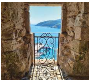
LA FINESTRELLA, San Nicola

Le Isole Tremiti sono raggiungibili in nave o in aliscafo dai seguenti porti: Termoli in Molise ( tutto l'anno ) e dalle città di Vasto, Vieste, Rodi Garganico, Peschici e Capotaormine. Da Foggia e Vieste partenze in elicottero . Reachable by ship or by hydrofoil from the ports of: Termoli in Molise (year-round) and Vasto, Vieste, Rodi Garg., Peschici and Capotaormine. From Foggia and Vieste helicopter departures.