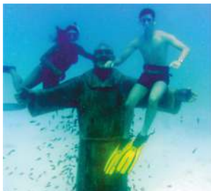
Statua immersa Padre Pio

Gli stranieri residenti sono 37 (2021) 8,2%