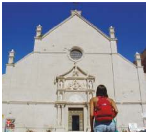
Abbazia di Santa Maria a mare

Sull'isola di San Nicola la splendida, millenaria Abbazia fortezza di Santa Maria a mare e i suoi pregevoli chiostri attinenti. Proseguendo dopo la chiesa, dopo i chiostri, passata la "Tagliata" (il punto più stretto dell'isola), si arriva sul "Pianoro", affascinante distesa ricca di vegetazione. Magico il bosco a San Domino e tutte le sue meravigliose calette facilmente raggiungibili. The splendid thousand-year-old fortress abbey of Santa Maria a mare and its cloisters attentive. The "Tagliata", the "Plateau", forest in S. Domino.