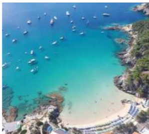
Cala delle Arene, San Domino

Ciao, sono l' Opuscolo Tutto In Tasca ®, ideato come supporto informativo, spero di esserti utile ! L'obiettivo è agevolarti nella ricerca di numeri, strutture, prodotti e servizi delle Isole Tremiti , stimolando la tua lettura con informazioni utili e curiosità. Sono disponibile anche on-line sul sito: Tuttointasca.it oppure su facebook : Tuttointasca. Realizzato da R.A.Pubblicità di roberto attanasio Tel. +39 347 2122191 • Suggerimenti: info@tuttointasca.it Ringrazio gli inserzionisti che hanno reso possibile il progetto. Messaggio promozionale, 30.000 copie, distribuzione gratuita. File di stampa: San Nicola delle Tremiti. 05/06/22. Salvo errori.