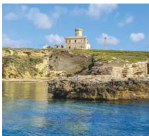
IL FARO DI CAPRARA

Le Isole Tremiti sono state dichiarate riserva marina con D.M. del 14/07/1989. Dal 1995 l'area fa parte del Parco Nazionale del Gargano. Per proteggere la vegetazione e le specie faunistiche, l'AMP Isole Tremiti è divisa in tre zone , con alcune limitazioni. The Tremiti Islands were declared a marine reserve by ministerial decree dated 14/07/1989. Since 1995 the area has been part of the Gargano National Park. To protect the vegetation and wildlife species, the AMP Isole Tremiti is divided into three zones, with some limitations. Respects the environment, thanks.