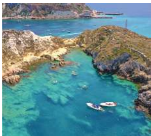
Cala grande, isolotto il Cretaccio