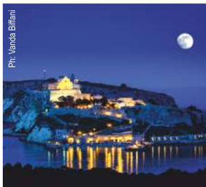
L'ISOLA DI SAN NICOLA