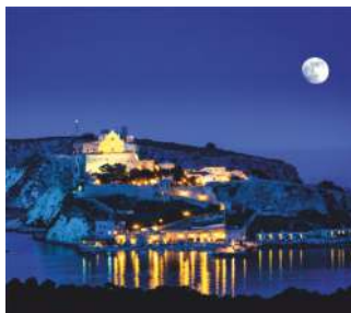
San Nicola

Se si vuole avere la sensazione di essere su un'isola consiglio una passeggiata sul pianoro di S. Nicola e a Caprara , dove lo sguardo si perde nello sconfinato mare e il silenzio che caratterizza questi luoghi rigenera i sensi . A San Domino si noleggiavano Bici, Quad e si può fare snorkeling nelle varie calette. Sul Cretaccio ogni tanto si avvistano persone libere di ricoprirsi di creta. Cammino, meditazione e silenzio nella pineta con Padre Max, partenza H.17 chiesa San Domino.