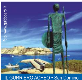
IL GURRIERO ACHEO • San Domino

L'arcipelago ha legato nel corso dei millenni il nome a quello dell'eroe acheo Diomede , tanto che in antichità le isole furono chiamate Diomedee. Si narra nacquero per sua mano quando gettò in mare tre giganteschi massi portati con sé da Troia e riemersero sotto forma di isole misteriosamente. La leggenda parla anche delle diomedee , uccelli particolari, dal nome riconducibile all'eroe greco. Si racconta che siano i compagni di Diomede , trasformati dalla Dea Afrodite e che piangono in ricordo del loro comandante nelle notte senza luna .