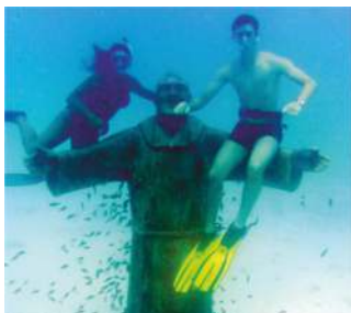
STATUA IMMERSA PADRE PIO

Comune più piccolo in Puglia per superficie (3,13 kmq) Comune con la più alta % di dichiaranti IRPEF (FG) E' il 3° comune più piccolo per n° di abitanti in Puglia Coordinate geografiche: 42°7'0"N 15°15'0"E Dal 1998 i fondali ospitano una statua di PADRE PIO Nel 1932 divennero comune autonomo di Isole Tremiti LUDOTECA "PICCOLI TREMITESI" • San Domino Ingresso a ore anche per piccoli turisti. T. 366 2061304