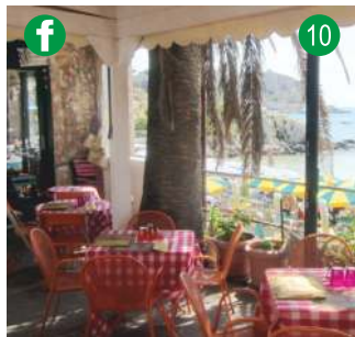
CALA PIETRE DI FUCILE • CAPRARA