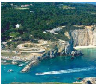
SAN DOMINO, LA SALITA E LA PIANA

IN AUTO: sulle isole nel periodo estivo non è possibile portarle salvo speciale permesso o per i residenti . Le Tremiti sono piccole, e piacevoli a piedi , anche scalzi. TRA LE ISOLE: frequenti in estate (ogni ora in 5 min.), in altri periodi puoi chiedere dello Sparviero o del Sig. Ino. TRAGHETTO NOTTURNO: si effettua più che altro solo nel mese di Agosto o su richiesta, informazioni al porto . TAXI: costano proprio poco ed evitano la salita per il paese, se hai bagagli, al porto trovi alcuni pulmini con conducente. PULMINI ALBERGHI: i vari pulmini degli alberghi e B&B aspettano i turisti a pochi metri dal porto (zona Livornese).