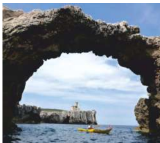
L'ARCHITIELLO DI CAPRARA

Splendide le grotte marine, le più famose quella delle Viole, dalla limpida acqua smeraldina, la Grotta del Bue Marino e la Grotta delle Rondinelle; pittoresche insenature e gli scogli dalle forme fantasiose come quelli dell'Elefante, l'Architiello di Caprara e i Pagliai. Beautiful sea caves, the most famous of which are the Violets with clear emerald water, the Grotta del Bue Marino and the Grotta delle Rondinelle; coves and rocks with imaginative shapes like those of the Elephant, the Architiello of Caprara and the Pagliai.