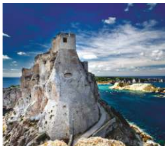
TORRE DEL CAVALIERE • San Nicola

l'arcipelago fu creato secondo la leggenda da Diomede, furono abitate già in epoca preistorica. Colonizzate dai Greci e dai Romani, nel secolo XI le Tremiti furono scelte dai Benedettini di Montecassino per costruirvi la grandiosa Abbazia di S. Maria a Mare che imperiosa s'innalza sulla suggestiva e incantevole isola di S. Nicola. Interessanti i vari ambienti, di cui ricordiamo il Torrione, il "Cavaliere del Crocifisso", il Bastione del Cannone, il Castello, la Chiesa e gli splendidi Chiostrì. Dopo molti secoli di vita religiosa, nel fine 700 le Tremiti divennero colonia penale, nel 900 il Governo Fascista istituì sulle Isole il confino di Polizia. A partire dagli anni '50 l'inizio dello sviluppo turistico.