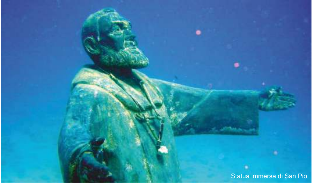
Statua immersa di San Pio

Splendidi fondali, vero paradiso per i sub, da vedere le grotte marine, la più famosa quella delle Viole dalla limpida acqua smeraldina, fantasiosi scorci di scogli come l'Elefante, l'Architiello e i Pagliai. Oltre il mare, le Tremiti offrono uno spettacolare museo a cielo aperto sull'isola di San Nicola con la splendida e quasi millenaria Abbazia fortezza di Santa Maria a mare e i suoi pregevoli chiostri a picco sul mare. Molto bello il bosco sull'isola S.Domino. Incantevoli le grotte marine e le piccole baie.