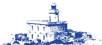
Relais Al Faro

Piccolo Relais con camere arredate con semplicità in stile mediterraneo, dotate di ogni confort, al centro di San Domino in una zona tranquilla e silenziosa. La Colazione viene servita all'ombra di una bellissima palma, a circa 50 mt dalla struttura, in un lounge bar della stessa proprietà. Le Camere e gli appartamenti sono tutti dotati di aria condizionata, bagno con doccia, phon, televisore e cassetta di sicurezza. Dista 200 mt. dalla spiaggetta di cala Matano. Free Bike.